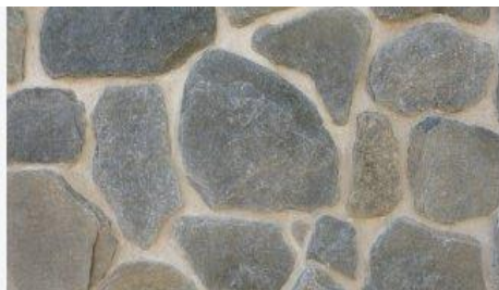
ANTI K NIGER