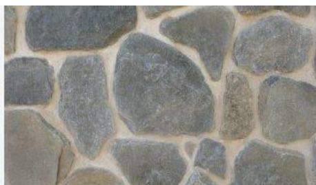
ANTI K NIGER