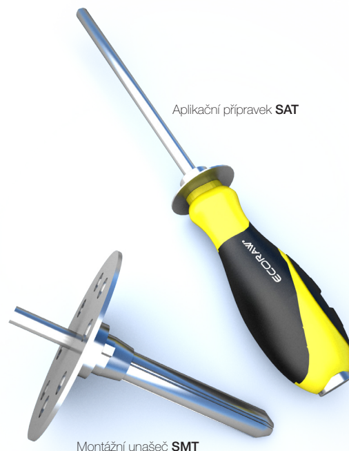
Aplikační přípravek SAT